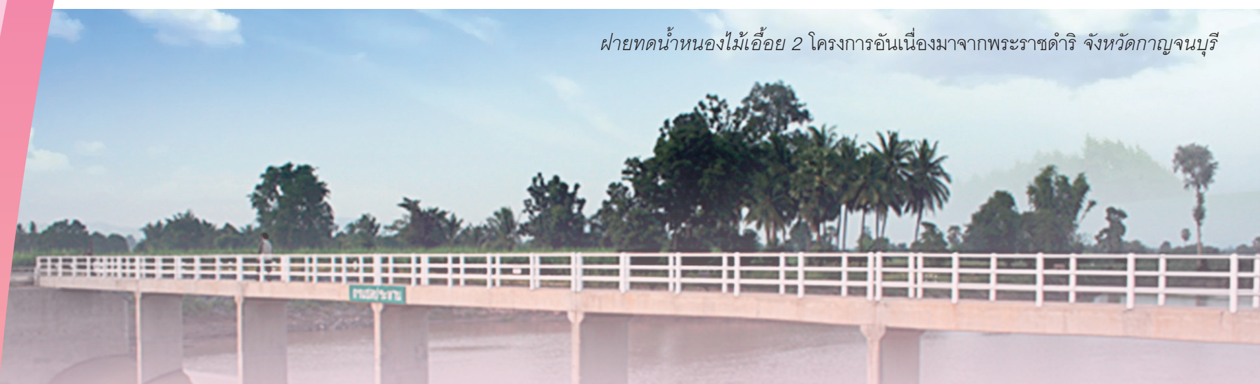
ฝ่ายเทคนิคของไม้เอื้อย 2 โครงการอันเนื่องมาจากพระราชดำริ จังหวัดกาญจนบุรี

ในจดหมายข่าวฉบับนี้ ขอกล่าวถึงเรื่องที่สำคัญงาน กปส. ได้ทำงานสนองพระราชดำริเกี่ยวกับงานด้านภูมิภา ซึ่งเป็นเรื่องที่ราษฎรในพื้นที่ต่าง ๆ ทั่วประเทศประสบความเดือดร้อนมีหนังสือถวายฎีกาถึงพระบาทสมเด็จพระเจ้าอยู่หัวให้ทรงทราบถึงความเดือดร้อน และขอพระราชทานความช่วยเหลือ ซึ่งฎีกาในส่วนที่เกี่ยวข้องกับสำนักงาน กปร. นั้นเป็นเรื่องที่ขอพระราชทานความช่วยเหลือในด้านการพัฒนาเพื่อให้มีชีวิตความเป็นอยู่ที่ดีขึ้น