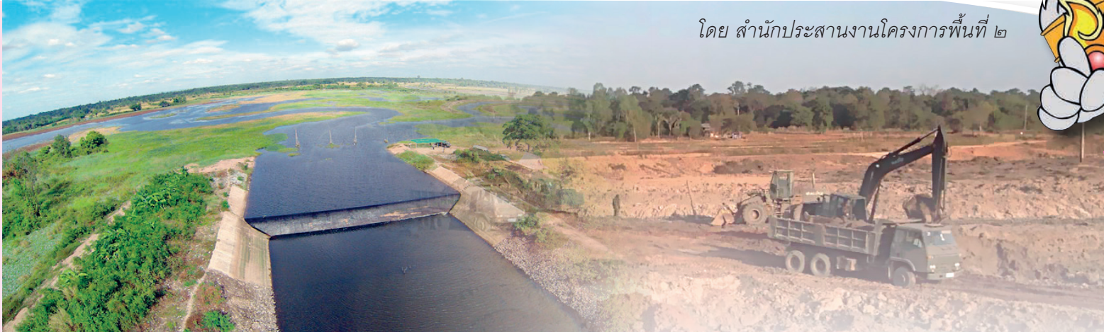
โดย สำนักประสานงานโครงการพื้นที่ ๒

โครงการพัฒนาแก้มลิงหนองเล็งเป็อย อันเนื่องมาจากพระราชดำริเป็นตัวอย่างการดำเนินงานเพื่อเพิ่มศักยภาพการใช้น้ำประโชชน์จากแหล่งน้ำโครงการอันเนื่องฯ ที่มีลักษณะการทำงานแบบบูรณาการ โดยกรมมีส่วนร่วมจากทุกภาคส่วน โดยมี ความเป็นมาและแนวคิดในการพัฒนาดังนี้